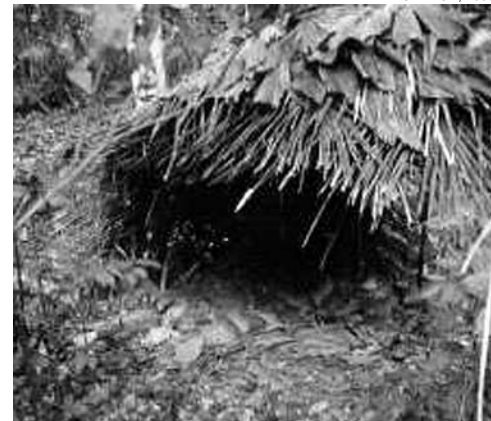
Acampamento Mashco, no Parque Nacional Alto Purús