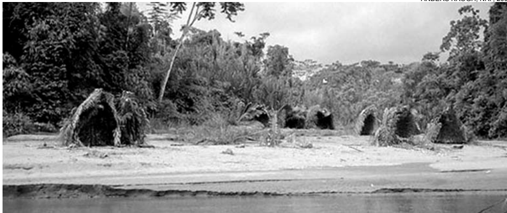
Acampamento Mashco-Yine numa praia do Rio de Las Piedras