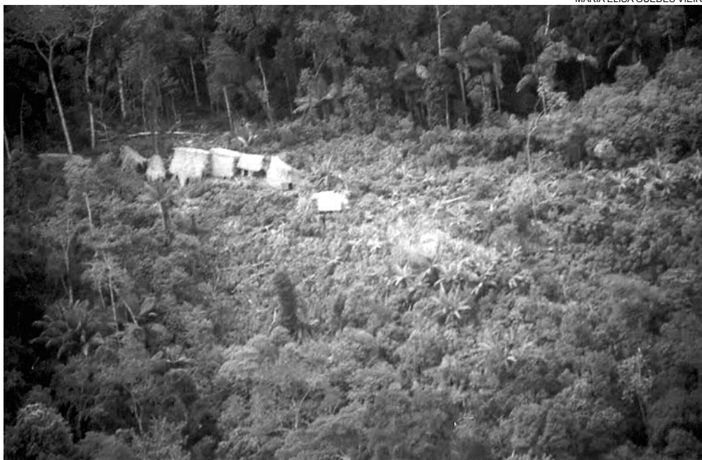
Conjunto de malocas identificado por GT da Funai na TI Riozinho do Alto Envira em 2004

Um outro estudo, "Uma investigação da extração ilegal de madeira no Parque Nacional Alto Purus e arredores", divulgado pela Parks Watch, em janeiro de 2005, traz conclusões igualmente esclarecedoras. Dentre as principais características dessa exploração, o estudo destaca: a) o desrespeito à proibição, por 10 anos, estabelecida pela Lei Florestal e de Fauna, de 2000, da extração de mogno (coba) e cedro; b) práticas de "esquentar" madeira retirada no Parque como se fosse oriunda de áreas de concessão florestal outorgadas pelo governo peruano, a oeste da "área natural protegida"; c) a ausência de qualquer fiscalização dos limites do Parque, bem como dos carregamentos de mogno dali extraídos, escoados por rio